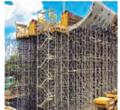
نظام تحميل الأبراج